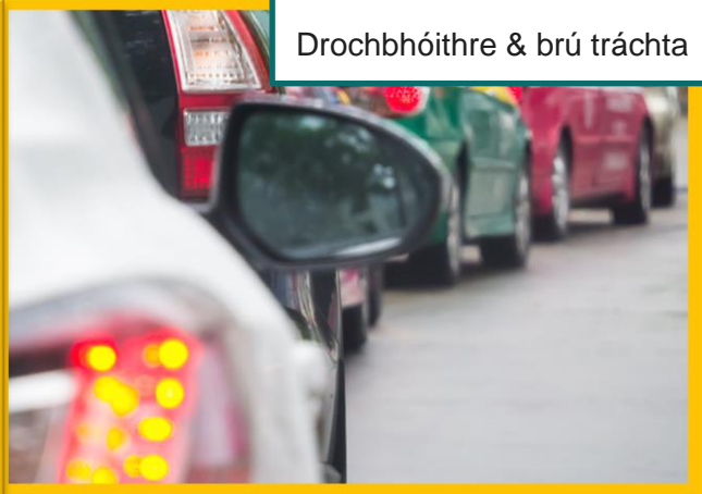
Drochbhóithre & brú tráchta